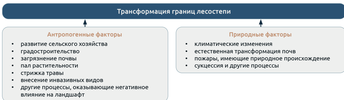
Fig. 1 Factors influencing the transformation of the forest-steppe boundaries